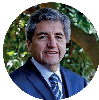
Palabras Carlos Recondo Lavanderos Director Nacional de INDAP