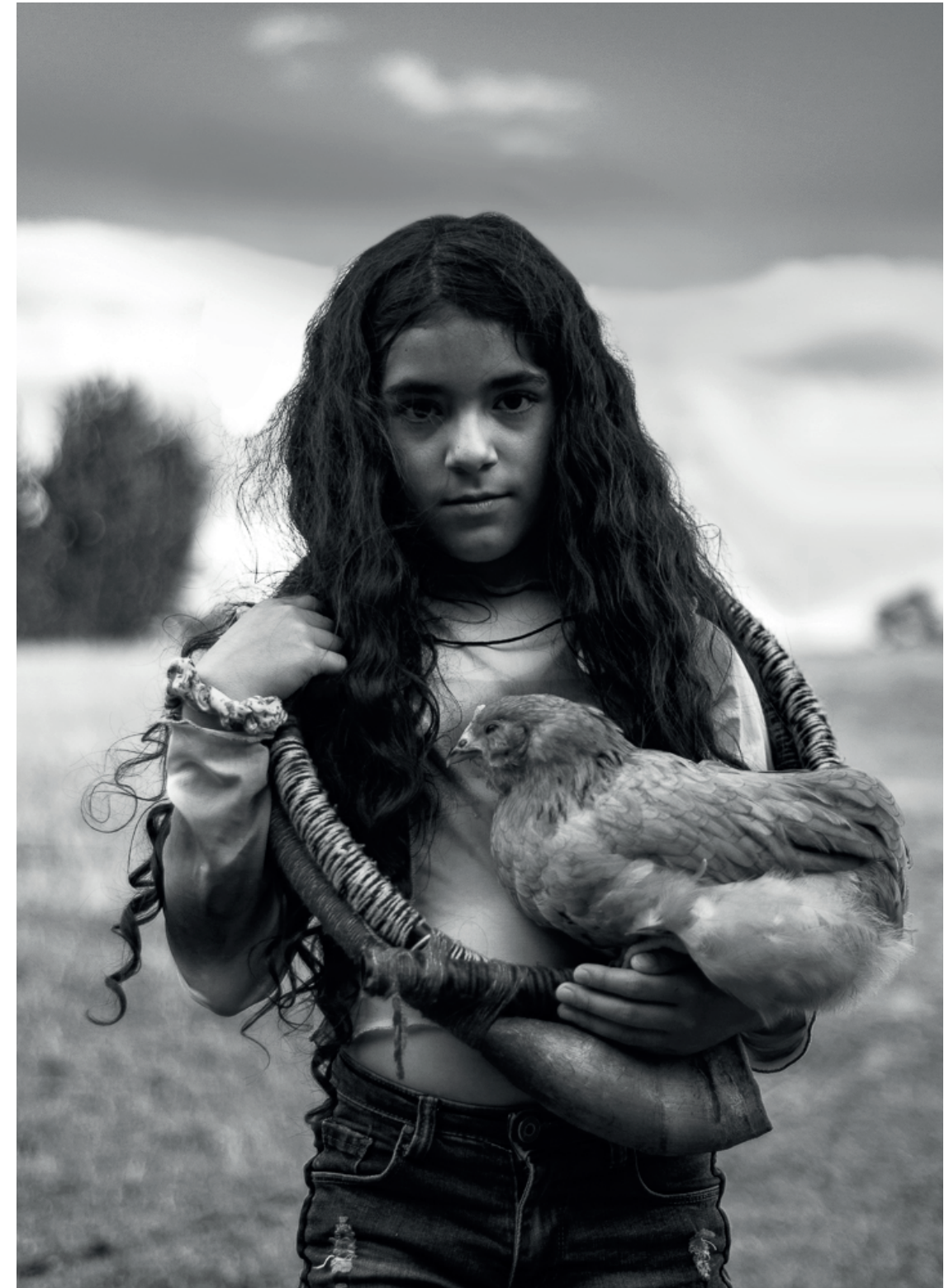
Imagen del proyecto fotográfico "NO A LA DISCRIMINACIÓN A NIÑOS/AS MAPUCHE" por el documentalista y diseñador Mario Kalfü @mariokalfu

Desde la preexistencia de los pueblos, se relata que la mujer mapuche o perteneciente a los pueblos no es feminista porque históricamente en la rewma , la familia, existe la dualidad. Sin embargo, nuestra cosmovisión promueve igualdad entre los hombres y mujeres, lo que permite el equilibrio para el " kome mongen ": el vivir bien. La diversidad de pensamiento que existe en los pueblos originarios y en las mujeres, permite que haya mujeres que se definen feministas de los pueblos originarios. Actualmente para la mujer mapuche ha sido mucho más adverso el enfrentarse a sociedad debido al racismo y elitismo que existe, ya que hay triple discriminación: por ser mujer, ser pobre y no estar consideradas en los estándares de belleza que hoy promueve la sociedad occidental.